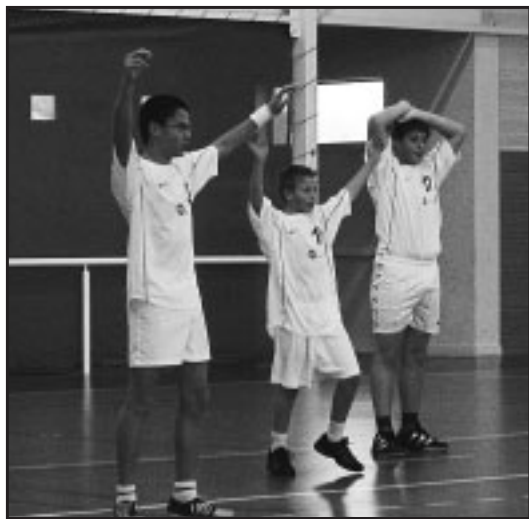
Les moins de 11 ans se sont illustrés lors du tournoi départemental.