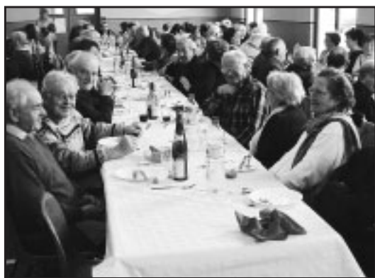
Les paroissiens de l'ensemble du Malsaucy n'ont pas manqué le rendez-vous convivial hivernal. RÉMY BORDES